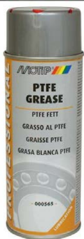
BELA MAST U SPREJU

Pre upotrebe mućkati sprej 2 minuta. Boca je pod pritiskom i zapaljiva je. Držati dalje od dece.