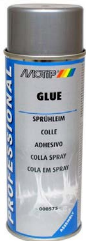
LEPAK U SPREJU

Visoko kvalitetan lepak za trajno i privremeno lepljenje. Pogodan za lepljenje papira, kartona, tekstila, drveta i raznih vrsta plastike. Brzo se suši i pogodan je za velike površine.