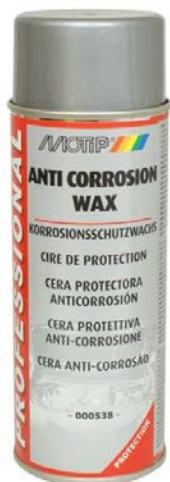
ANTI KOROZIVNI VOSAK

Visoko kvalitetni vosak za zaštitu i prevenciju od korozije. Otporan je na vremenske uticaje, slabije kiseline i baze.