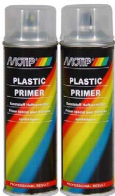
TEMELJNA BOJA ZA PLASTIKU

Boca je pod pritiskom, držati dalje od izvora toplote i domašaja dece.